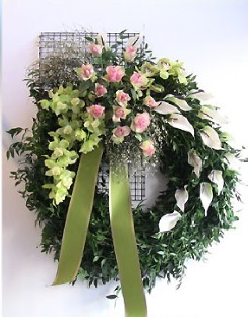
Modello 12 - € 250,00