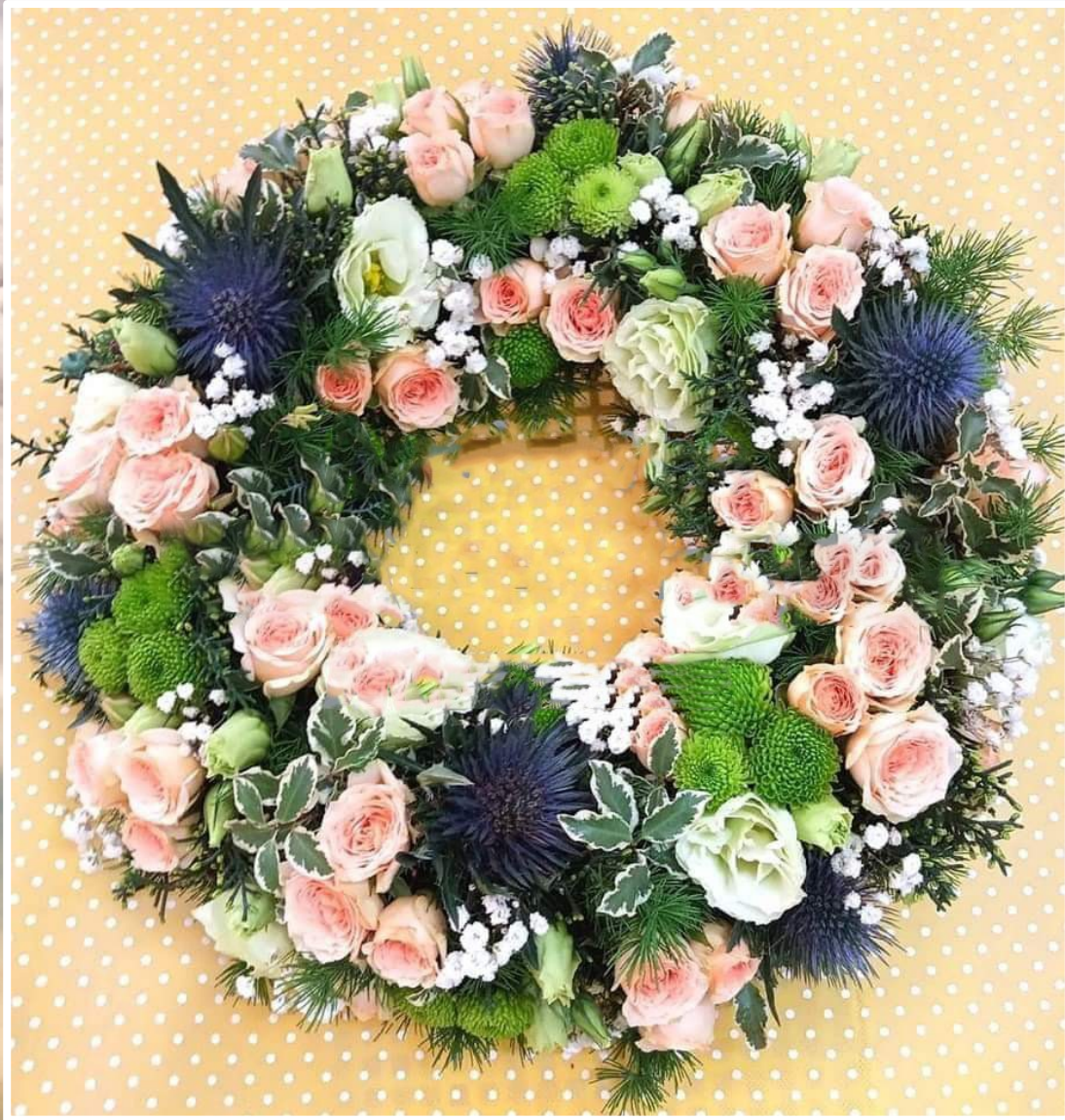
Modello 6 - € 250,00