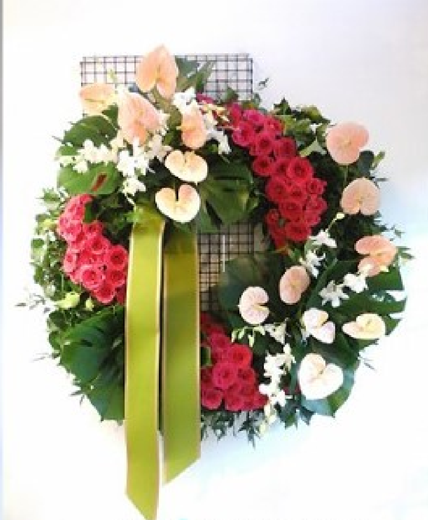
Modello 9 - € 250,00