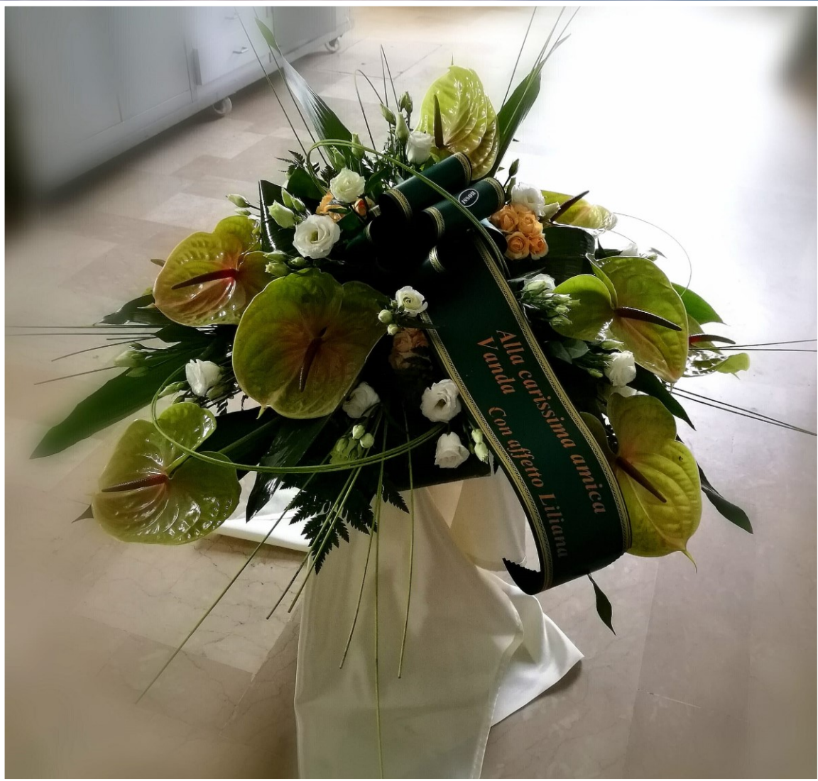
Modello 16 - € 60,00