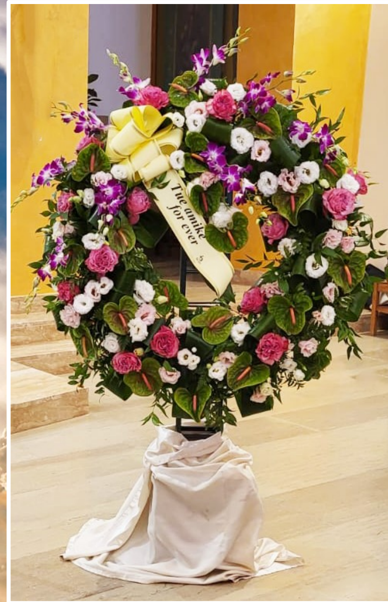
Modello 5 - € 250,00