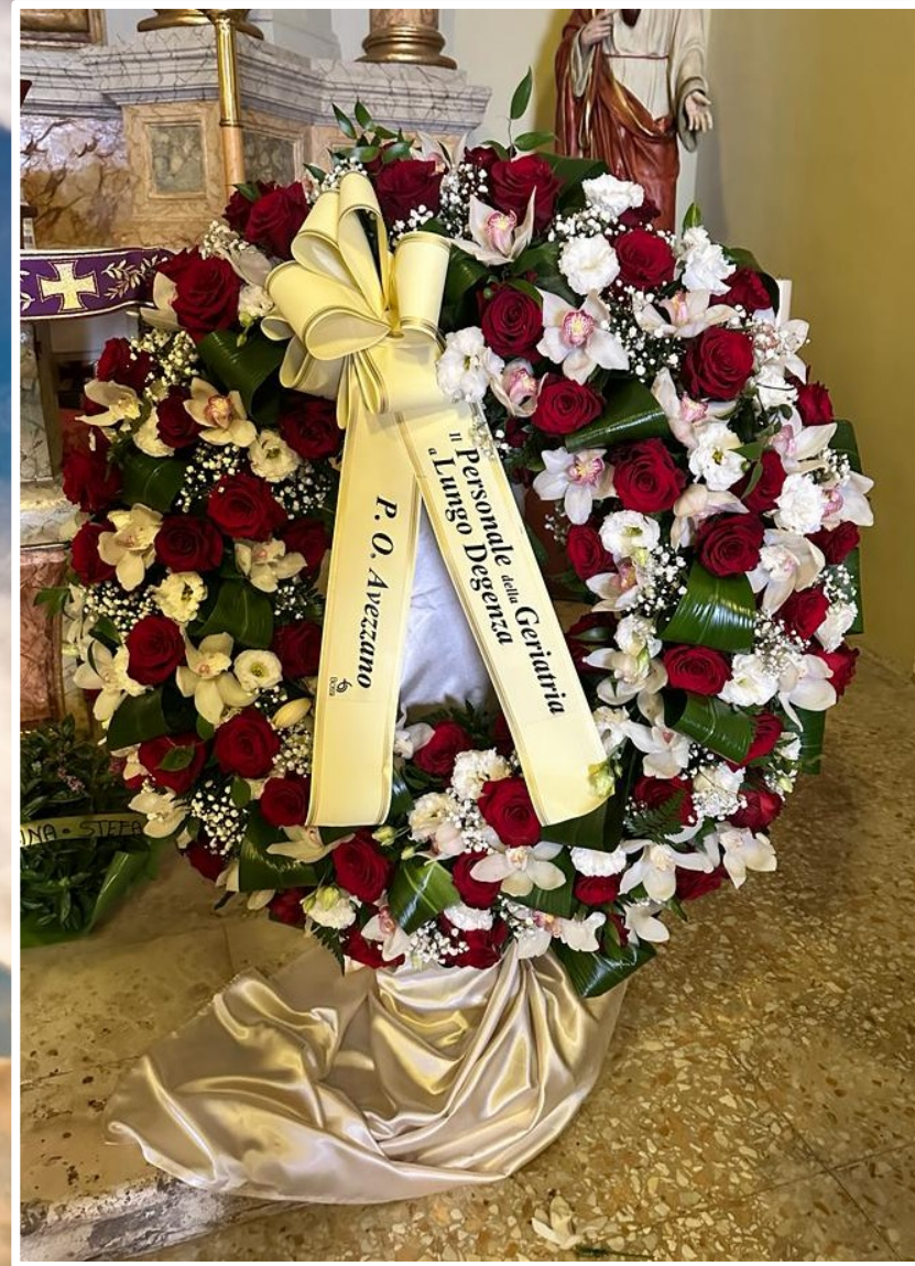
Modello 7 - € 300,00