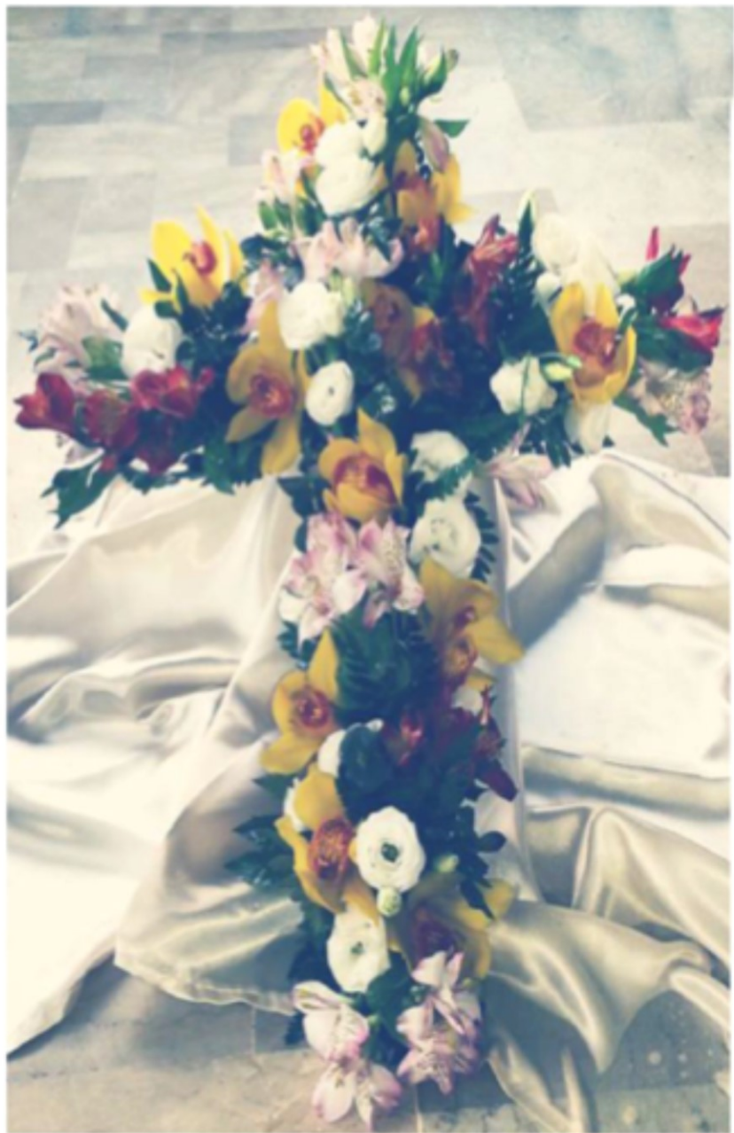
Modello 14 - € 80,00