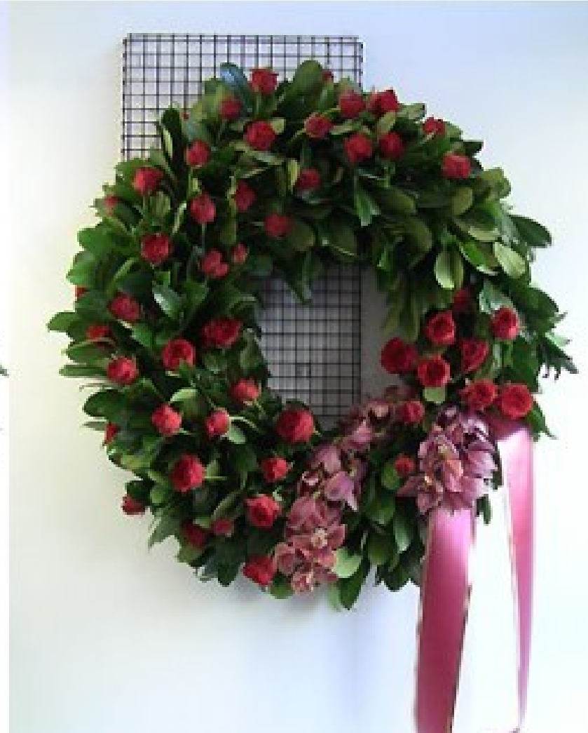
Modello 13 - € 250,00