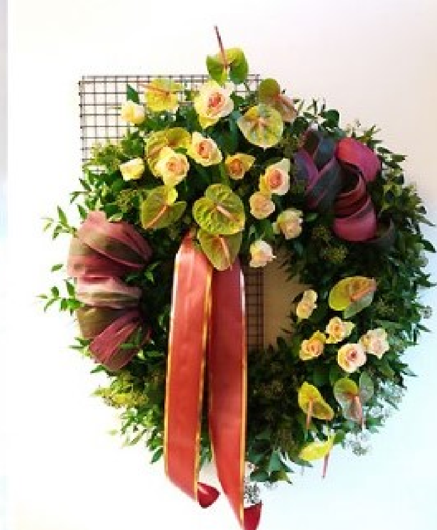
Modello 10 - € 250,00