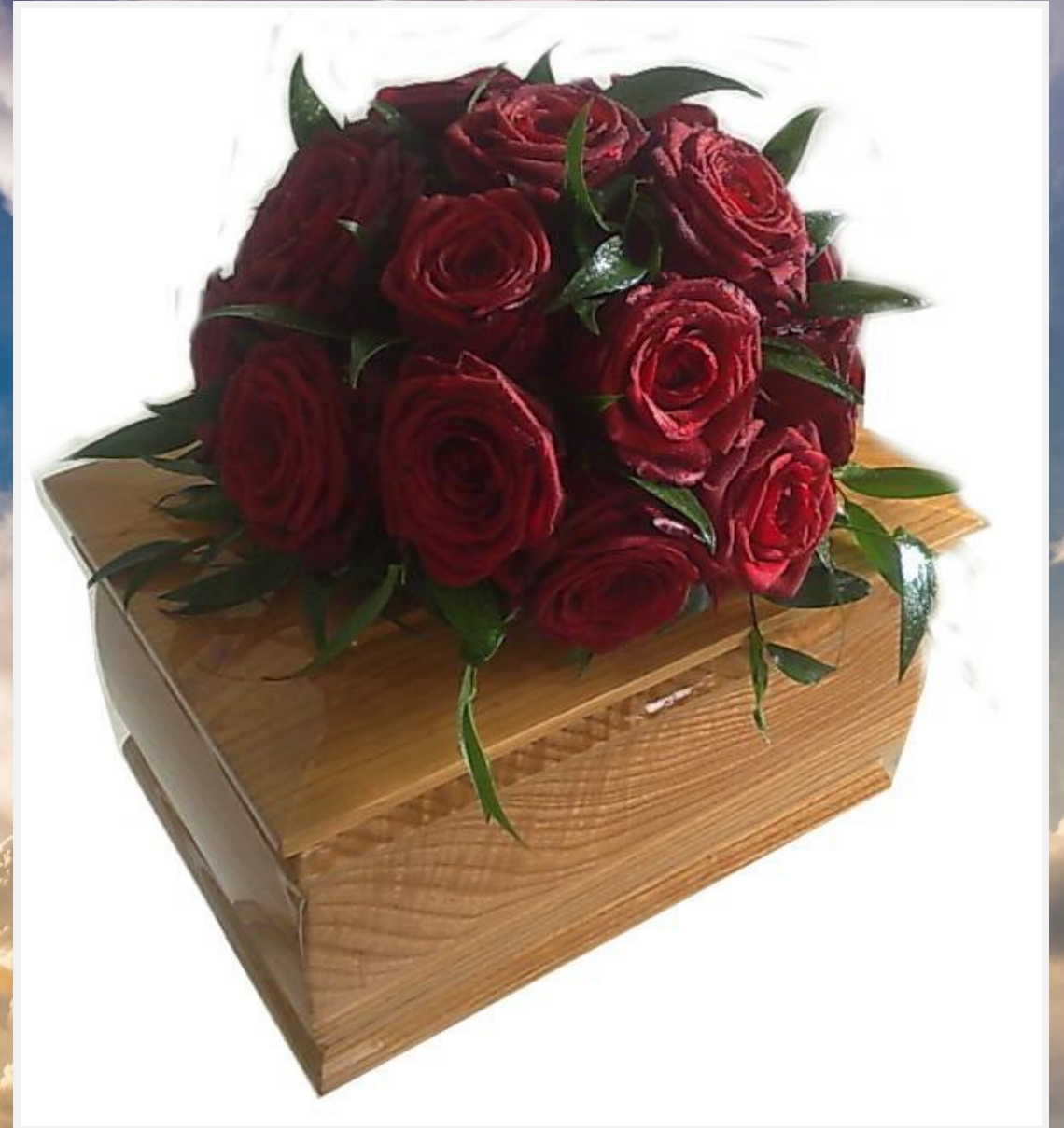
Modello 24 - € 50,00