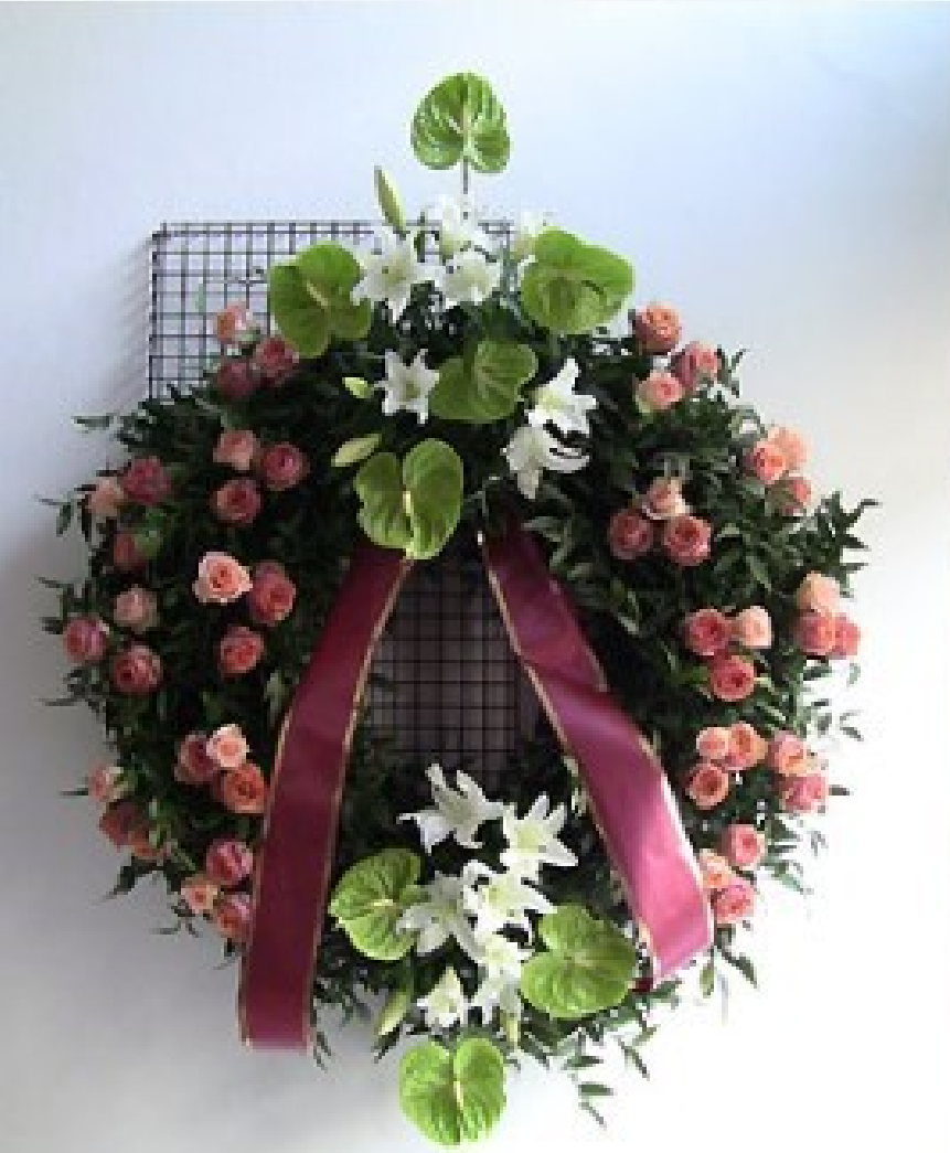
Modello 11 - € 200,00