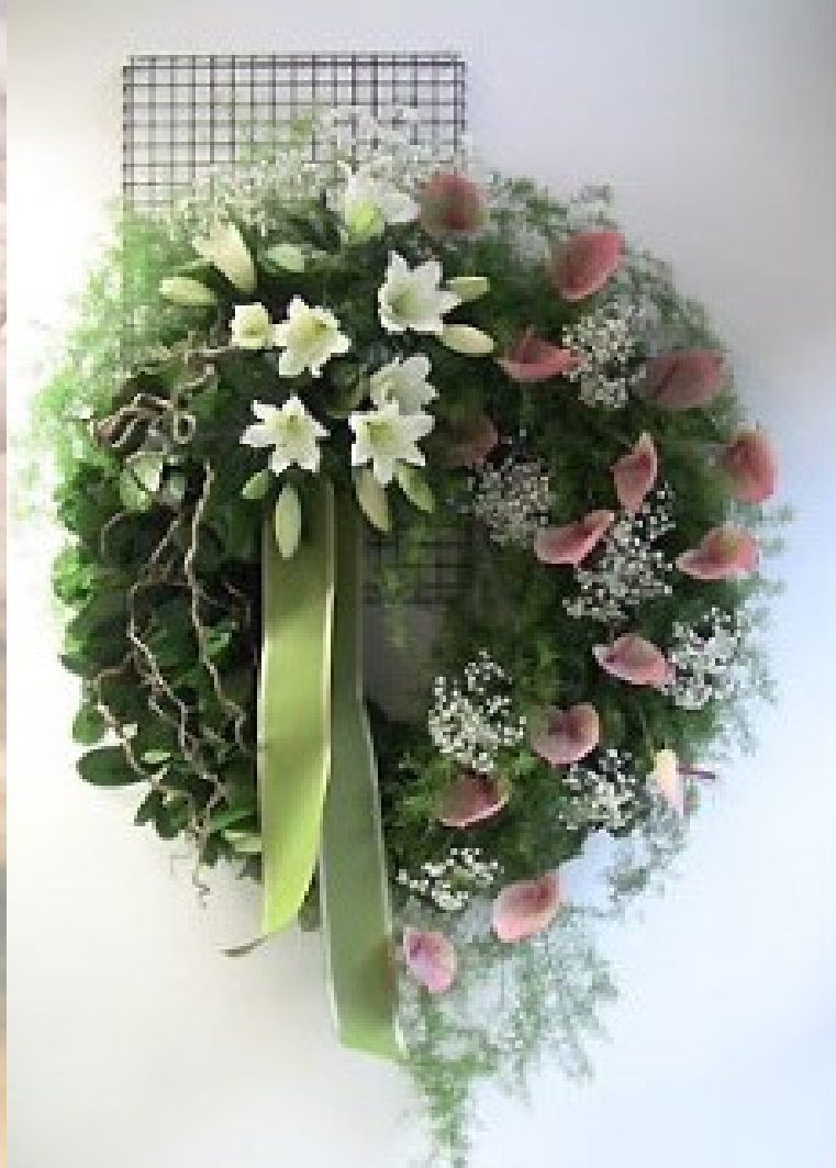
Modello 8 - € 200,00