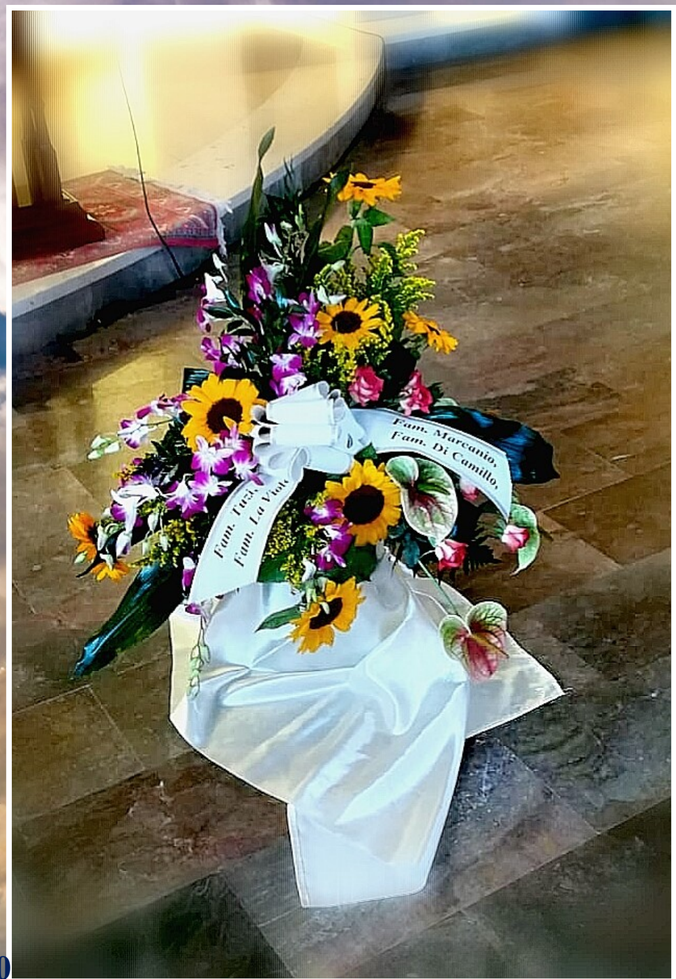
Modello 17 - € 80,00