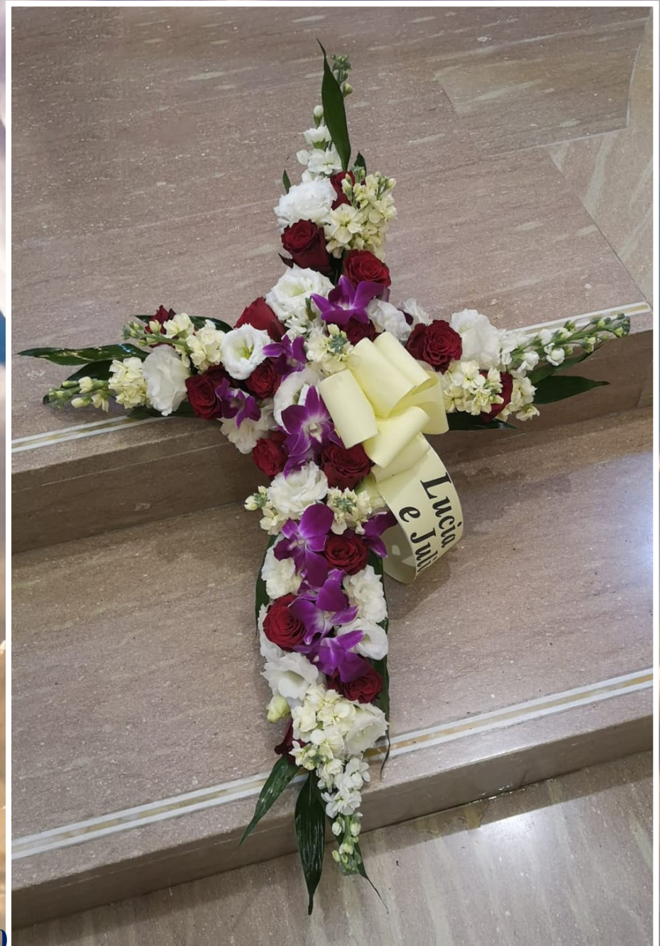
Modello 15 - € 70,00