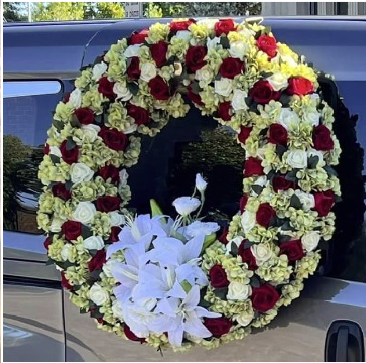
Modello 4 - € 300,00