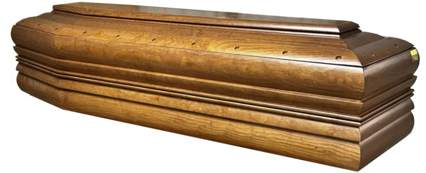
Essenza: Noce Mediterranea tinta B